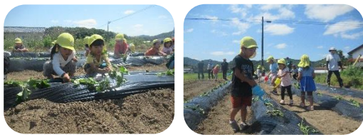
さつまいもの苗を植えたよ！（たいよう組・きのこ組）